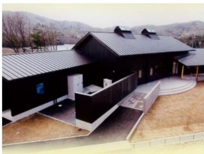
グループホーム大山田 いこいの里