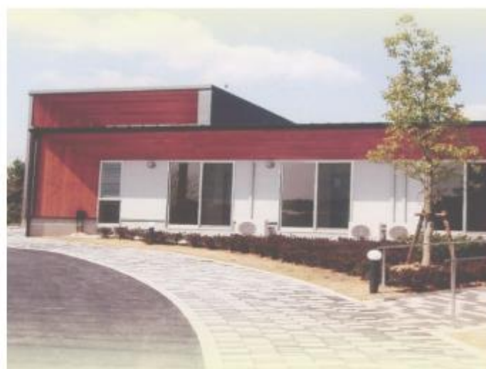
グループホーム伊賀まち いこいの里